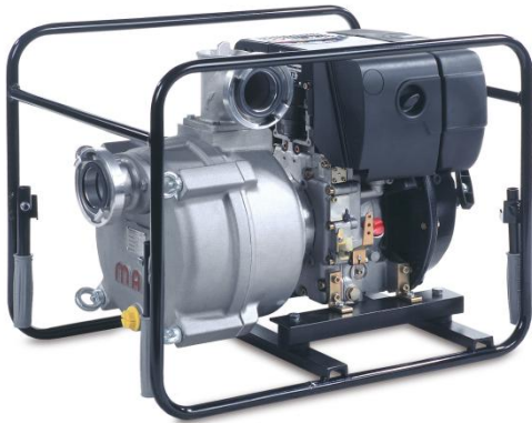
Förderhöhe H m (WS)