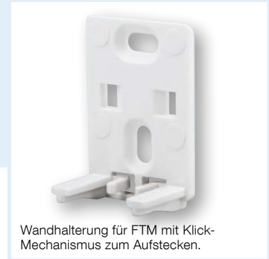
Wandhalterung für FTM mit Klick-Mechanismus zum Aufstecken.