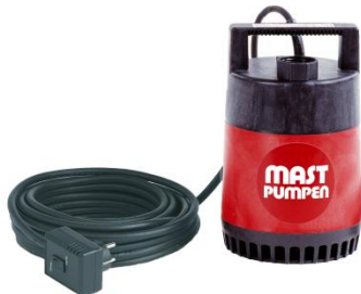
Förderhöhe H m (WS)