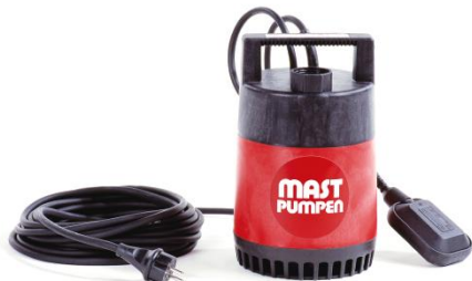
Förderhöhe H m (WS)