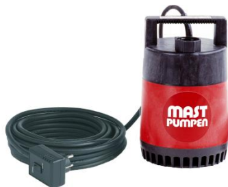
Förderhöhe H m (WS)