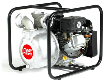
Förderhöhe H m (WS)