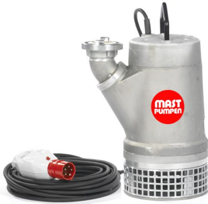
Förderhöhe H m (WS)