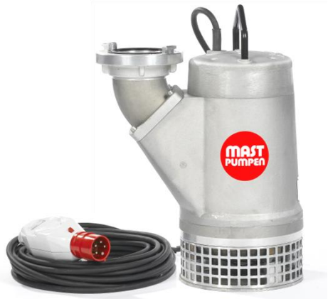
Förderhöhe H m (WS)