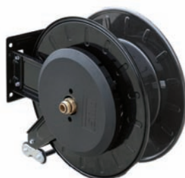
Schlauchhaspel AdBlue® (ohne Schlauch) - 1 x Schlauchhaspel mit drehbarem Schlauchanschluss - 1 x Schlauchklemme - 1 x Schlauchschutzfeder - 1 x Schlauch-Stopp Druckverlust 0,1 bar @ 35 L/min Art.Nr. P750060