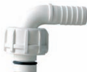
90° ø 3/4" x F1" BSP Art.Nr. P15484