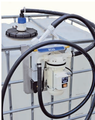
AdBlue® BASIC zum zweckmäßigen Betanken

Die automatisch abschaltende Pistole erleichtert das Betanken. Die genaue Menge lässt sich über das Zählwerk ablesen.