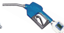
AdBlue®-Zapfpistole mit Zählwerk