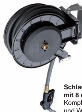
Schlauchhaspel AdBlue® mit 8 m EPDM-Schlauch 3/4" Komplett mit drehbarem Anschluss und Winkel. Druckverlust 0,4 bar @ 35 L/min Art.Nr. P750070 (Zapfpistole nicht im Lieferumfang enthalten)