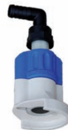
Sauganschlüsse SEC HDPE Plastik für CDS- Saug Schlauch Art.Nr. P15452