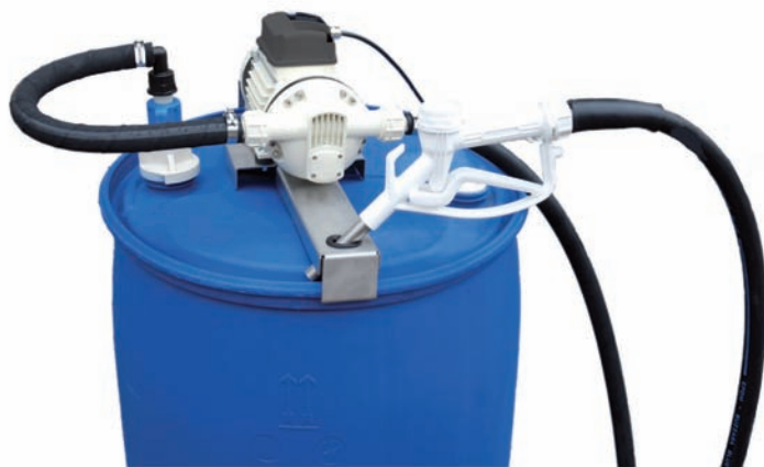
AdBlue® DRUM (ohne Fass) auch mit automatischer Zapfpistole erhältlich