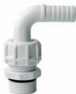
90° ø 3/4" x M1" BSP Art.Nr. P15485