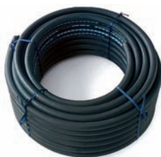
EPDM Saug- Schlauch 3/4" Art.Nr. P14124