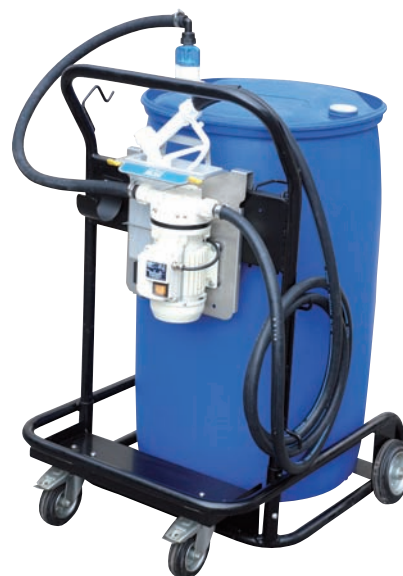
AdBlue® Trolley (ohne Fass) für BASIC und PRO