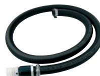
EPDM Ansaug- garnitur mit Fußventil Art.Nr. P14146