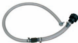
Saug Schlauch mit IBC- Tankbodenanschluss und Rückschlagventil Art.Nr. P15515