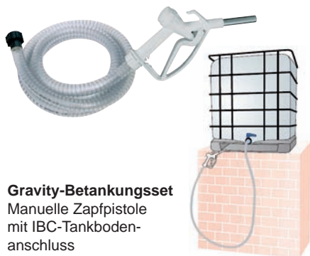
Gravity-Betankungsset Manuelle Zapfpistole mit IBC-Tankboden- anschluss Art.Nr. P15517