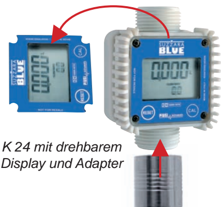
K 24 mit drehbarem Display und Adapter