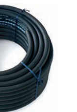
EPDM Druck- Schlauch 3/4" Art.Nr. P141255