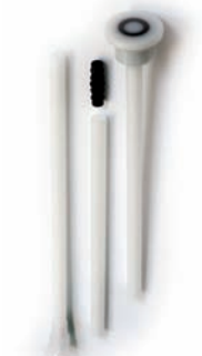
Saug Schlauch mit Schnellkupplung SEC / CDS Art.Nr. P15606