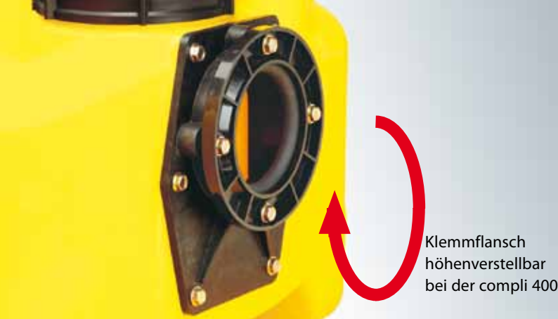
Klemmflansch höhenverstellbar bei der compli 400