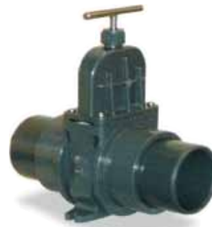
PVC Zulaufschieber DN 100 oder DN 150 mit eingeklebten Rohrstützen für zeit- und platzsparen- den Direktanschluss an den Zulaufklemmflansch.